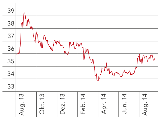
Terminmarkt Strom 2015

Die Terminpreise für Strom, Erdgas und Kohle gingen im Geschäftsjahr 2013/14 deutlich zurück. Die Preise für CO 2 -Zertifikate verharrten hingegen auf tiefem Niveau.