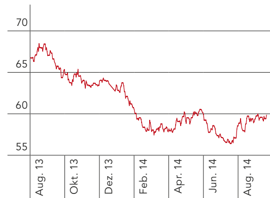
Coal API#2 Cal 15